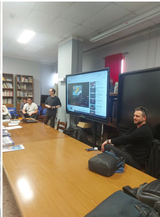
Photos from the event